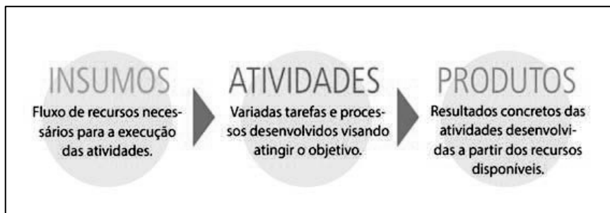
Figura 1 - Dimensões de Monitoramento e seus Conceitos

Serão observadas, nos processos de monitoramento, as seguintes dimensões: insumos, atividades e produtos.